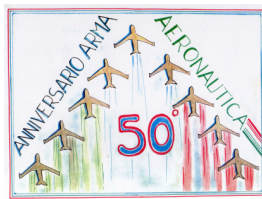
CEFFA Sofia 1 a C