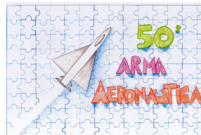
BARBIERI Giada 2 a D