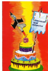
CUOMO Giorgia 3 a