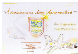
ROSSI Kristal 3 a D