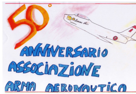
IANNE Massimiliano 2 a C