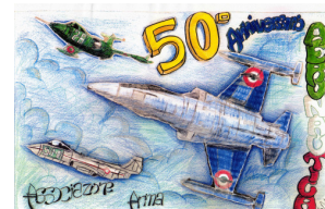
CLINTON W. Ogbobor 3 a B